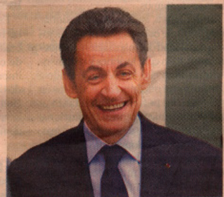
Nicolas Sarkozy con su inseparable corbata azul.

Capítulo aparte merece comentar el mal gusto en las corbatas de los actores más