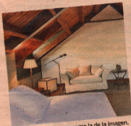
Algunas habitaciones, como la de la imagen, están abuhardilladas.

Hotel Primero Primera, C./ Doctor Carulla 25-29, Barcelona. Tfno: 93 417 56 00. Precio hab. doble: desde 160 € con desayuno. Suite: desde 310 €. www.primeroprimer.com