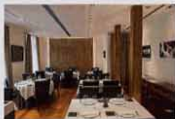
La nueva sala aporta más espacio, luz y confort.