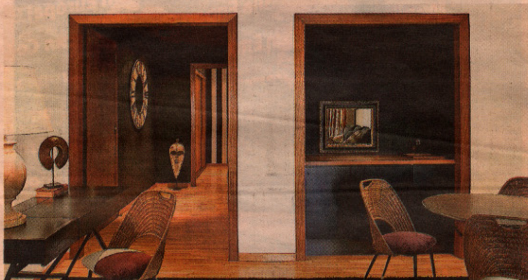
En este hotel, además de 30 habitaciones, hay dos completos apartamentos, perfectos para familias.