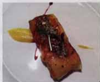
Fole micuit con queso San Simón caramelizado, pipas de calabaza sobre pan de cereales y pasas.

C/ EDUARDO DATO, 5. MADRID. TEL: 91 395 28 53. CIERRA LOS DOMINGOS. WWW.RESTAURANTELUA.COM