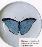
Plato de cerámica, de In Dietro. 59€ ( www.indietro.com ).

Los sábados y los domingos son sagrados, y se preparan festines matutinos que pueden llegar a convertirse en un auténtico «brunch»