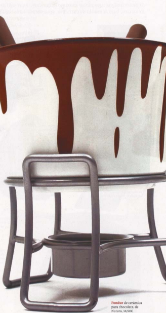
Fondue de cerámica para chocolate, de Natura, 14,90€ (tel. 91 341 2532).