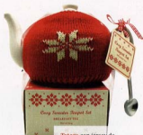
Tetera con jersey de ganchillo, de Natura. 13,90€ (tel. 91 431 2532).