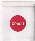
Caja para guardar el pan. 49€ ( www.stopandwalk.com ).