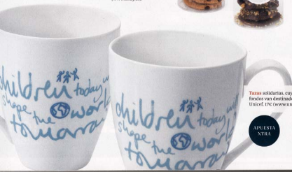
Tazas solidarias, cuyos fondos van destinados a Unicef. 17€ ( www.unicef.es ).