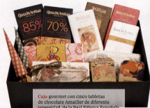
Caja gourmet con cinco tabletas de chocolate. Amajiller de diferente intensidad, de la Real Fábrica Española. 45,79€ ( www.tienda.realfabrica.com ).