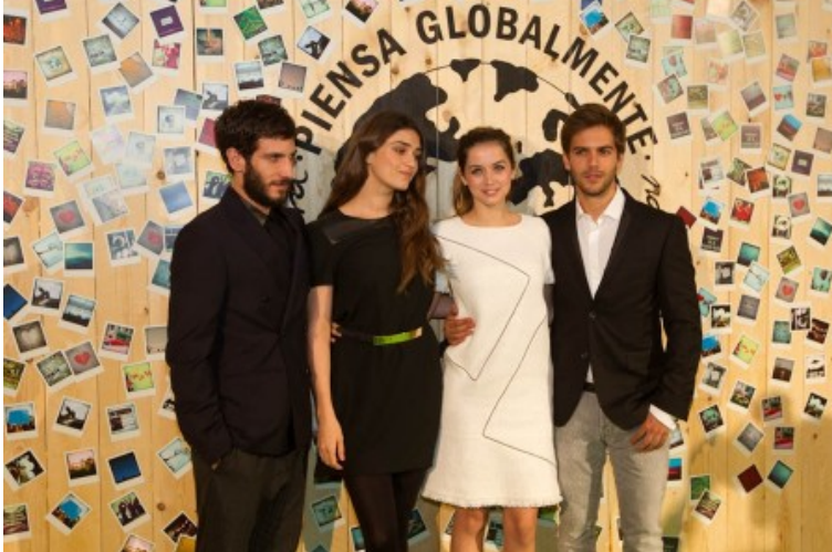
Quim Gutiérrez, Olivia Molina, Ana de Armas y Marc Clotet.