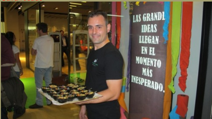
Pase de bandeja

El catering de CENTRAL CAFÉ es a base de enrollados rellenos de diferentes ingredientes, de mini bocatas de pan de molde y de chapata calientes, cazuelitas de humus y de guacamole... Probablemente