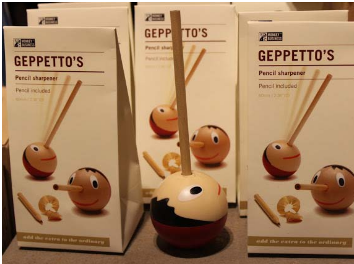
Original sacapuntas y su lápiz.