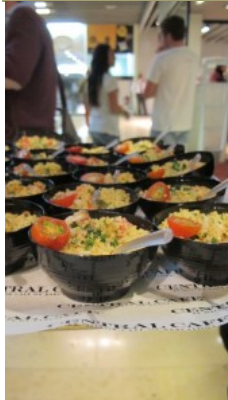
Cazuelitas con Taboulé