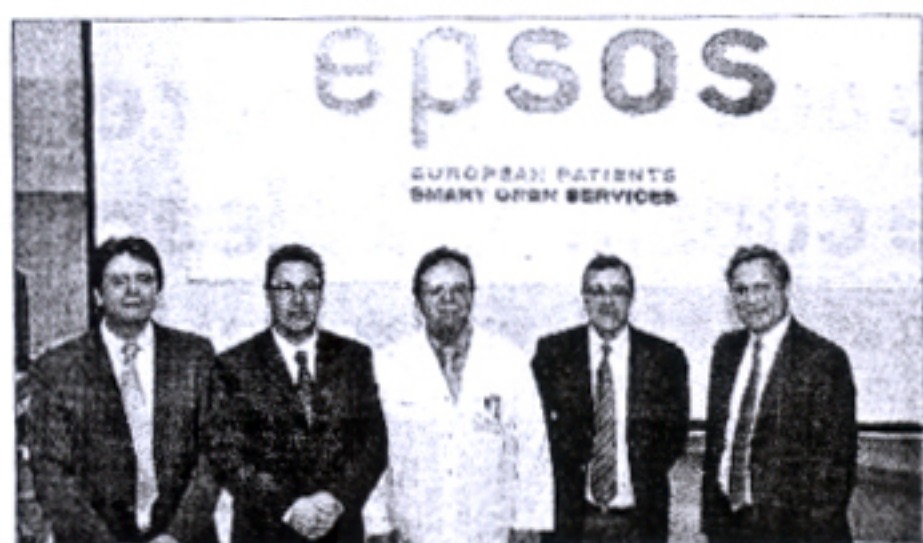
Foto de familia de la presentación del proyecto en Son Espases.